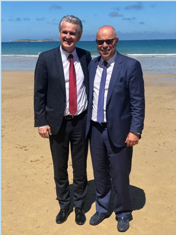
Председателят Анадолиев с председателя на гръцкия нотариат - г-н Георгиос Рускас

македонския нотариат и обсъдихме въпросите, които касаят нотариатите на Балканите. Заедно с тях, както и с гръцкия председател, дискутирахме възможната организация на Балкански съюз на нотариатите. Присъствах на обучение, свързано с електронни автентични актове и национални информационни системи в Европа. Също така обсъдих и членските условия за българския нотариат относно използването на услугите на Европейския регистър на завещанията (ARERT) с координаторката на Асоциацията на европейската мрежа на регистрите на завещанията. По време на участието ми в Общото събрание, както и в неформална обстановка, успях да затвърдя международната дейност на българската Нотариална камара.